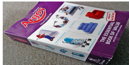
Papurau newydd a Chatalogau